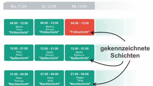
Welche Mitarbeiter haben vergangene Woche welche Schichten belegt?

Aus diesen Ergebnissen können Sie so die für die nächste Dienstplanung faire Einteilungen ableiten. Mehr zu Papershift Fairness erklären wir Ihnen gerne in einem persönlichen Gespräch.